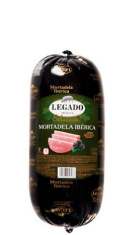
Mortadela Ibérica Produtizada com carne de porco Ibérico.