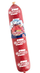
Salame Imperial Salame tradicional espanhol com sabor suave.