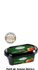
Patê de Jamón Ibérico Patê gourmet com o melhor do Jamón Ibérico e páprica. Deve ser grelhado ou assado com pão.