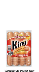
Salsicha de Pernil King Receita gourmet com carne 100% de pernil e textura macia. Tamanho diferenciado (16cm)