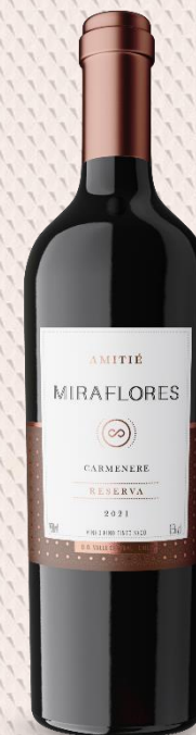
Amitié Miraflores Reserva Carmenera Elaborado com uvas 100% Carmenera