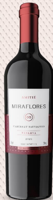
Amitié Miraflores Reserva Cabernet Sauvignon Elaborado com uvas 100% Cabernet Sauvignon