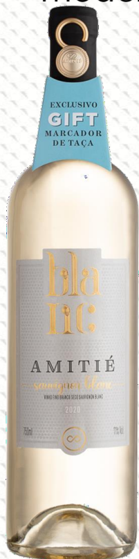
Amitié Blanc Sauvignon Blanc Elaborado com uvas 100% Sauvignon Blanc.

Edição limitada de variedades elaborados na Serra Gaúcha. Rótulos jovens, versáteis e modernos.