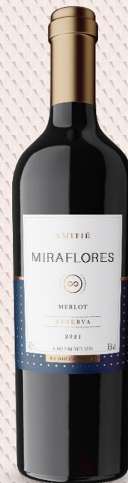
Amitié Miraflores Reserva Merlot Elaborado com uvas 100% Merlot