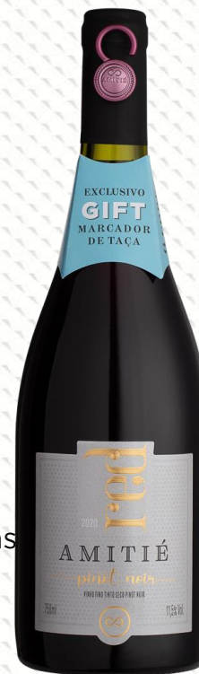
Amitié Red Pinot Noir Elaborado com uvas 100% Pinot Noir